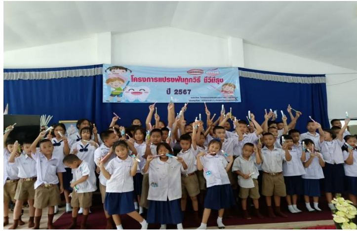
- อุปกรณ์การดูแลสุขภาพช่องปาก แปรงสีฟัน ยาสีฟัน และเม็ดสีย้อมฟัน